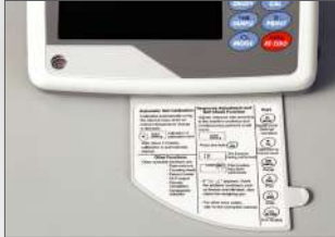
Handleiding voor dagelijks gebruik