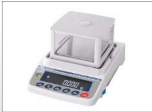
Optioneel met glazen stofkap