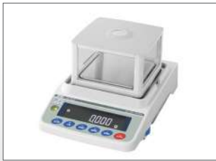
Optioneel met glazen stofkap