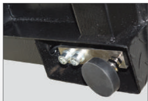
Zéér stabiel door voetsteun

Doorrijdplateau voorzien van 4 loadcellen