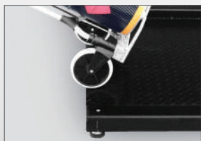
Eenvoudig op en af rijden