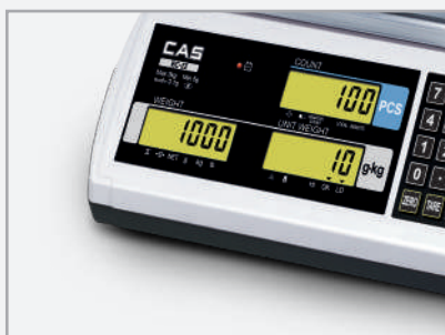
Geel display: Te laag gewicht of aantal (Lo)

De EC-II serie is de ultieme controleweegschaal. Door de kleurindicatie ziet u direct of uw gewicht/aantal te licht, te zwaar of juist is. Door de checkweegfunctionaliteit is de kans dat u te veel of te weinig product afweegt nagenoeg nihil. Hiermee bespaard u direct vanaf de eerste weging, waardoor uw investering razendsnel kan worden terugverdiend.