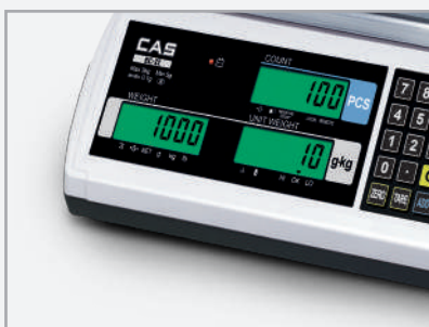
Groen display: Juist gewicht of aantal (Ok)