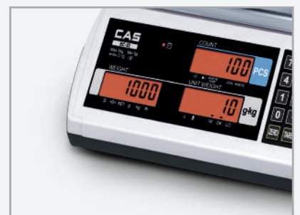
Rood display: Te veel gewicht of aantal (Hi)