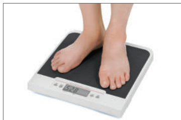
Display naar de patiënt toe