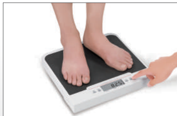
Display van de patiënt af