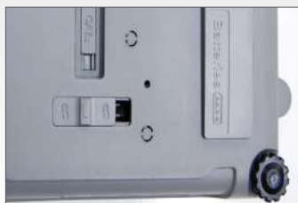
Loadcell lock voor veilig transport