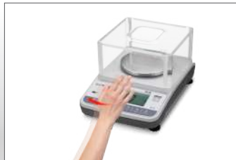
Zonder aan te raken tarreren

Checkweegfunctionaliteit Tijdsbesparing en kostenbesparing