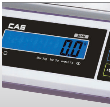
Display met blauwe achtergrondverlichting